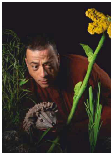
Lagoa Pequena (Estação das Letras)