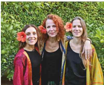
Uma Volta ao Mundo (Mundos da Música)