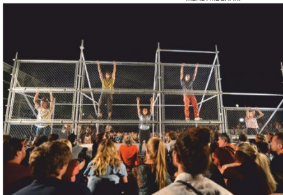
D-Construction, pela comp. a Dyptik

21h55 / Largo 5 de Outubro (frente ao Bar n.º 6) / 20'