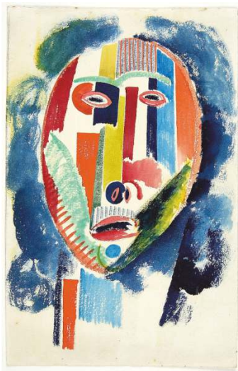
Amadeo de Souza-Cardoso (1887-1918). Título desconhecido, c.1915. Museu Calouste Gulbenkian.

Partindo do tema « Atravessar culturas através dos tempos », acordado por todos os parceiros do projeto, o Centro de Artes de Sines reúne em exposição obras que falam de muitas viagens. Cada uma destas obras irá mostrar-nos, de diferentes formas – mais ou menos explícitas –, a bagagem que o artista traz para as viagens que connosco se propõe fazer.