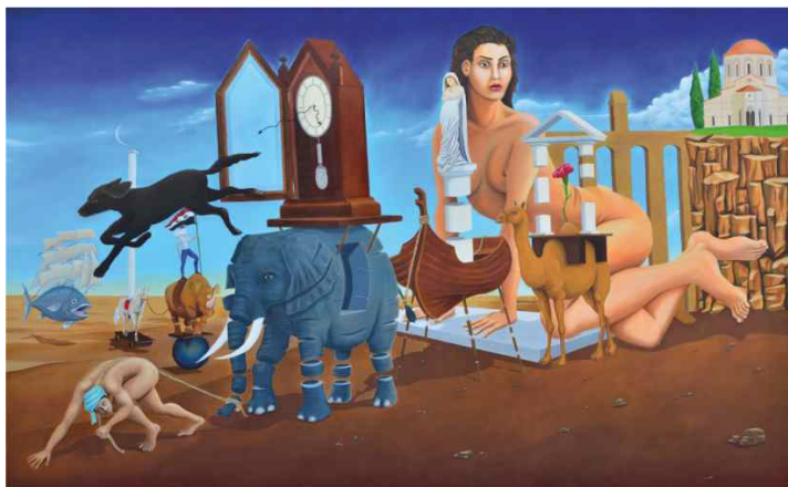
Êxodo Sírio. Óleo sobre tela

24 de novembro de 2017 a 21 de janeiro de 2018