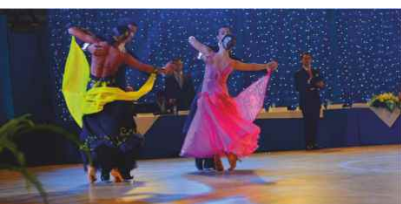
Festival de Danças de Salão 23 JUL