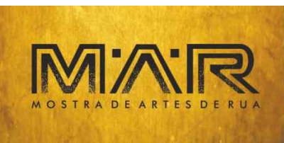
M.A.R. - Mostra de Artes de Rua 18-20 AGO