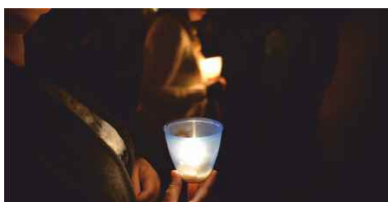
Festas religiosas AGO