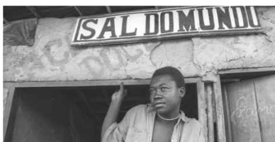
Verão Arte Contemporânea 16 JUL-06 NOV