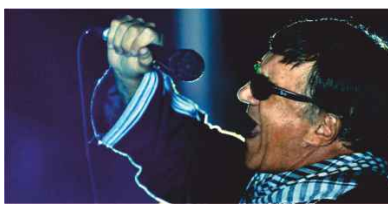
Concerto de José Cid 12 AGO