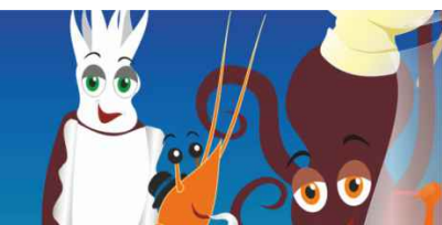
Tasquinhas Sines 16 JUL-07 AGO