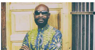
FMM Sines 2016 22-30 JUL