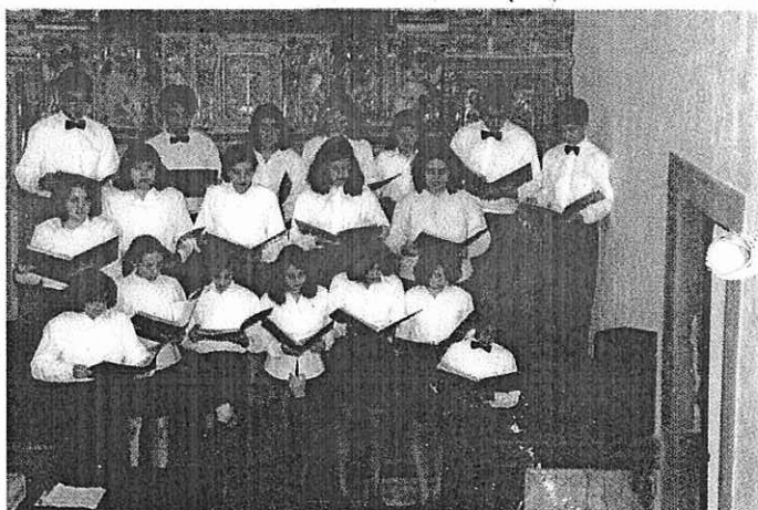
Coro Polifónico de Évora