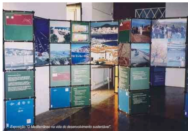
Exposição "O Mediterrâneo na via do desenvolvimento sustentável".

Além do debate, o Dia Mundial do Turismo foi assinalado com uma exposição, patente na Capela da Misericórdia entre 26 de Setembro e 18 de Outubro, sobre os conflitos entre ambiente e desenvolvimento (turístico e não só) na zona mediterrânica, onde se inclui, por influência, mais de um terço do território nacional. Intitulada "O Mediterrâneo na via do desenvolvimento sustentável", a exposição integrou a campanha "Ulisses 21" que o GEOTA se encontra a promover, em parceria com o MED Fórum.