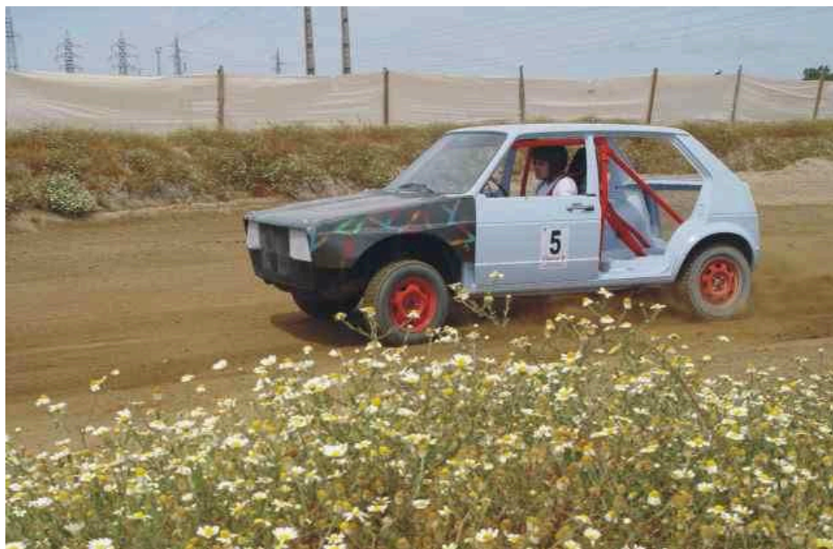
Carro em competição na prova realizada na pista da Ribeira dos Moinhos, dia 1 de Julho (Foto: Rui Reis / Setubalense).

"Este ano fizemos um campeonato - começou em Fevereiro e terminou em Setembro -, que teve o patrocínio de uma agência de viagens e um