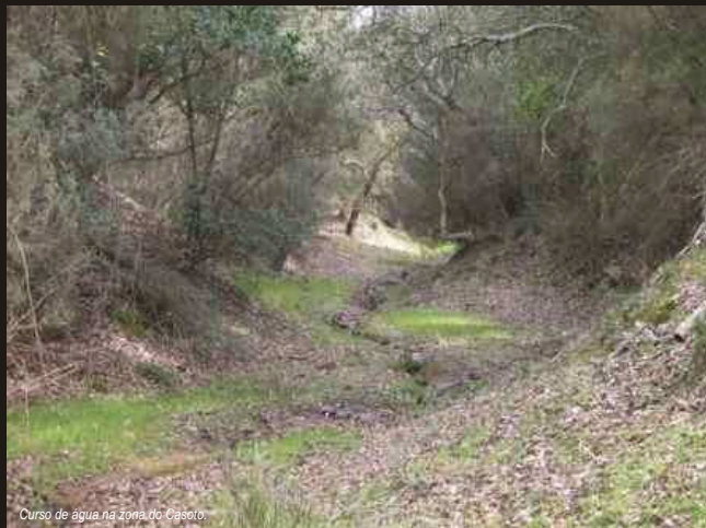
Curso de água na zona do Casoto.

A zona do Casoto, recebe, nos dias 22 e 23 de Novembro, o I Troféu de Orientação Pedestre "Cidade de Sines". Espera-se cerca de 1000 participantes.