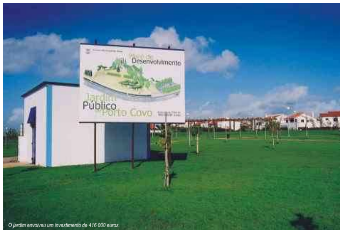
O jardim envolveu um investimento de 416 000 euros.

É uma estrutura de grande importância para o embelezamento e para a melhoria da qualidade de vida na aldeia.