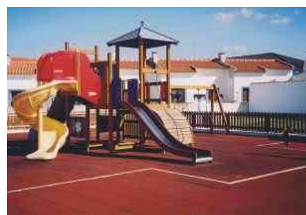
O jardim tem um pequeno parque infantil.