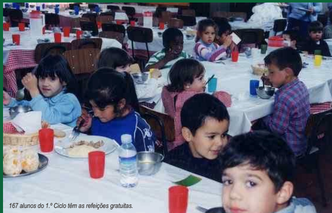
167 alunos do 1.º Ciclo têm as refeições gratuitas.

Outros números e novidades do trabalho da Câmara Municipal de Sines para a Educação.