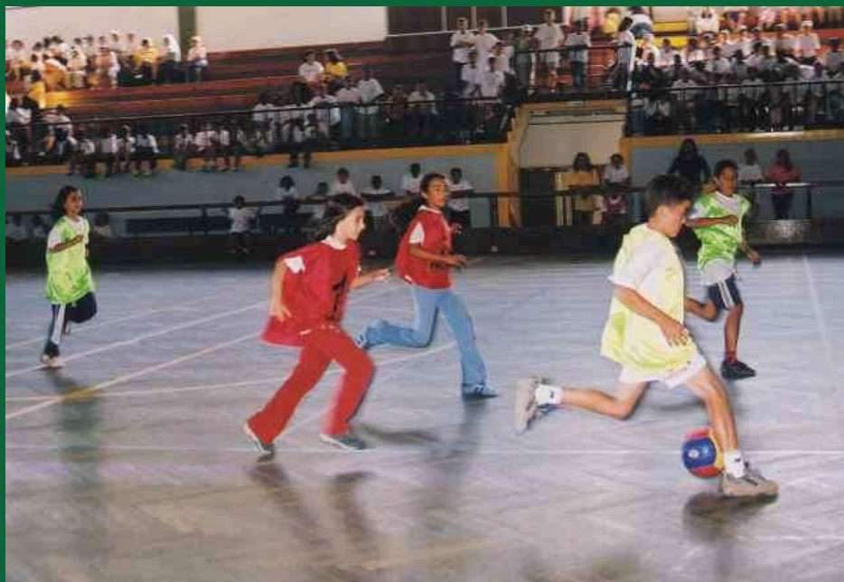
As Olimpíadas Escolares têm início em Janeiro de 2004.

As Olimpíadas Escolares passam também a ter início mais cedo, em Janeiro de 2004, prolongando-se até Junho. O regime do desporto escolar nos infantários mantém-se inalterado.