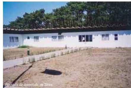
Pousada da Juventude de Sines.

O CONSELHO Municipal da Juventude, reunido no dia 23 de Setembro, nos Paços do Concelho, aprovou uma moção onde exprime a sua "surpresa e desagrado" sobre as notícias que dão conta do encerramento da Pousada da Juventude de Sines.