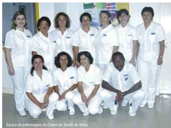
Equipa de enfermagem do Centro de Saúde de Sines.

Quais são as principais dificuldades da equipa de enfermagem