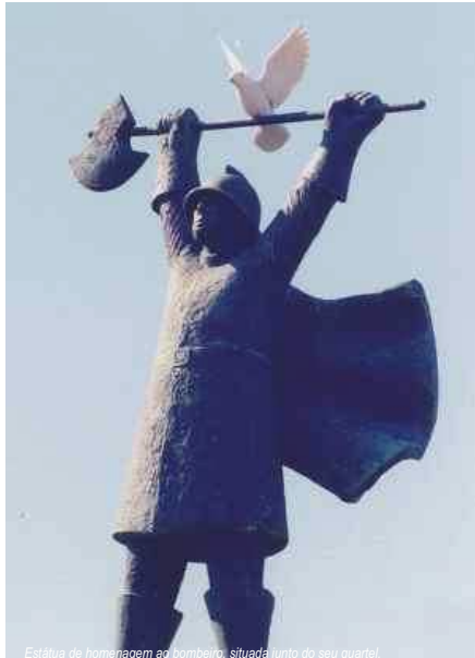
Estátua de homenagem ao bombeiro, situada junto do seu quartel.

Aquilo que neste momento lhes é facultado é apenas a isenção de taxa moderadora nos serviços de assistência médica. Há também algumas compensações em termos de reforma. Mas a melhor compensação para um bombeiro voluntário, tal como eu sou, é depois de um dia, depois de uma noite, depois de uma semana, sentirmos que estamos cansados, física e psicologicamente, mas que contribuímos para minorar o sofrimento ou até salvar uma pessoa. Basta isso. Mas ser bombeiro não é só querer, é também sentir. Há pessoas que estão lá há 40 anos e outras que só ficam uns meses porque acabam por sentir que a sua vocação não é essa.