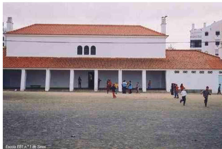
Escola EB1 n.º 1 de Sines

Este novo modelo encontra-se em fase de experimentação este ano. Sentiu-se a necessidade de fazer algumas mudanças em relação ao implementado em anos anteriores. Até agora, o desporto escolar está a decorrer bem, embora por vezes seja necessário recorrer