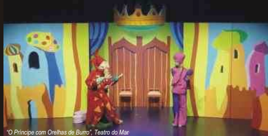
"O Príncipe com Orelhas de Burro", Teatro do Mar

"Continuaremos a lutar contra esta apatia generalizada que nos rouba a identidade e o fôlego. Se calhar, há uma certa loucura em acreditar que no deserto ainda seja possível sobreviver à seca, plantando alguns sonhos que nos possam ir saciando a sede. Mas, quando o discurso é este, o da sobrevivência, para que a esperança não morra e o nosso trabalho faça sentido e tenha utilidade, para nós e para os outros, continuaremos a ouvir a voz das ruas e a do coração e, através da nossa arte, denunciar o que nos inquieta e expressar o que nos