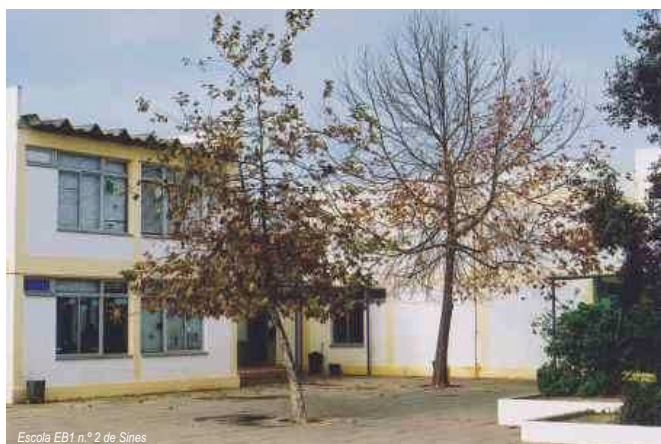
Escola EB1 n.º 2 de Sines

Os problemas com os quais este Conselho Executivo se tem debatido seriam solucionados certamente com a construção de uma escola nova, com salas suficientes para todos os alunos a frequentarem no mesmo horário e com as mesmas condições.