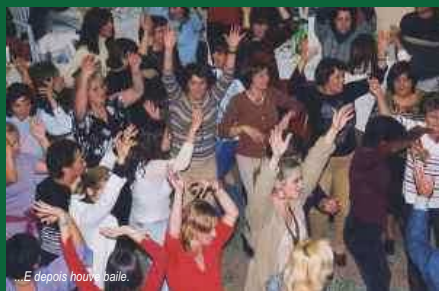
E depois houve baile.

desporto escolar, etc.) e dá apoio aos restantes estabelecimentos de ensino do concelho (das escolas profissionais é co-gestora).