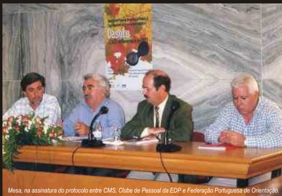
Mesa, na assinatura do protocolo entre CMS, Clube de Pessoal da EDP e Federação Portuguesa de Orientação.

O troféu é aberto a pessoas de qualquer idade e sexo, podendo participar em escalões individuais, pares, principiantes individuais ou em grupos. Os escalões de competição podem inscrever-se até 8 de Novembro (há uma prorrogação do prazo, com multa, até dia 15). Os