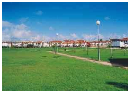
O jardim tem um amplo relvado para repouso e prática de jogos.