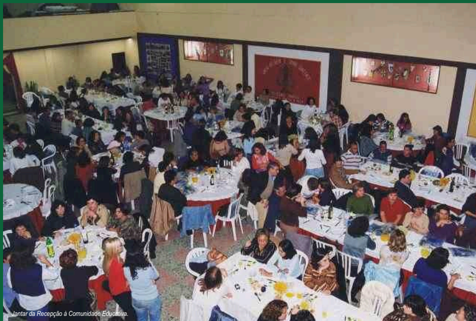
Jantar da Recepção à Comunidade Educativa.

A Câmara Municipal de Sines tem responsabilidade directa sobre as escolas do primeiro ciclo do ensino básico (equipamentos, apoio social, transportes,