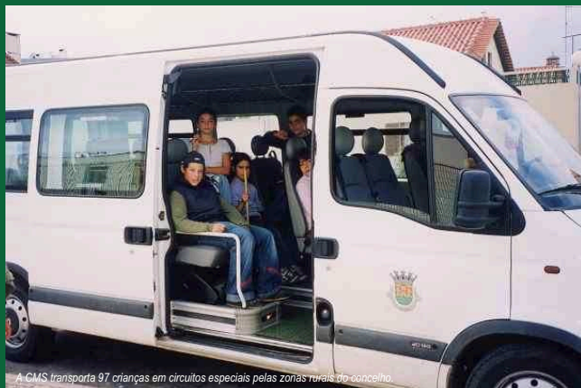
A CMS transporta 97 crianças em circuitos especiais pelas zonas rurais do concelho.

As Escolas EB1 n.º 1 e n.º 2 de Sines vão receber, através da Câmara Municipal de Sines, um apoio de 16 500 euros do Ministério da Educação para melhorar as suas bibliotecas (9 000 euros para fundo documental e 7 500 para equipamento e mobiliário). Nas candidaturas sineenses à Rede Biblioteca Escolares, foi ainda aprovada a atribuição de 6000 euros para a Escola EB 2,3 Vasco da Gama e 5 500 euros para a