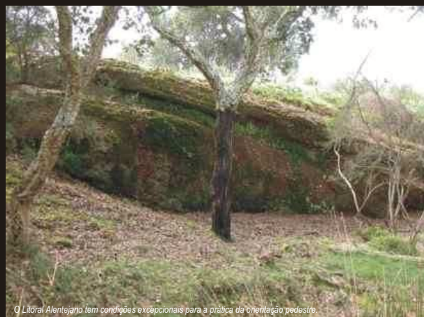
O Litoral Alentejano tem condições excepcionais para a prática da orientação pedestre.

"É um investimento rentável na qualidade de vida e na projecção deste concelho", diz o autarca. "É um alargamento da oferta desportiva em Sines - que já é um dos municípios com maiores índices de actividade física